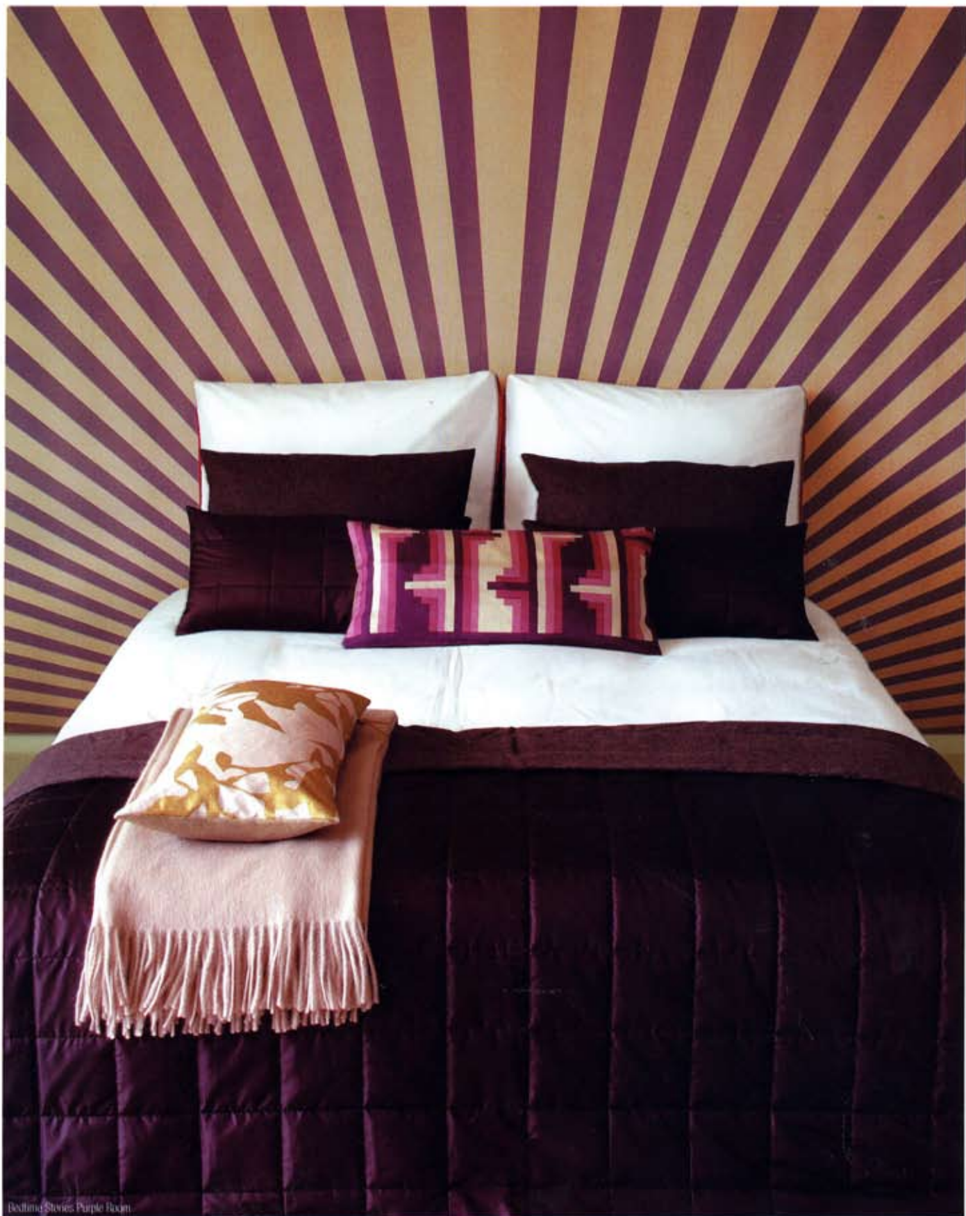
Bedding Stories Purple Room