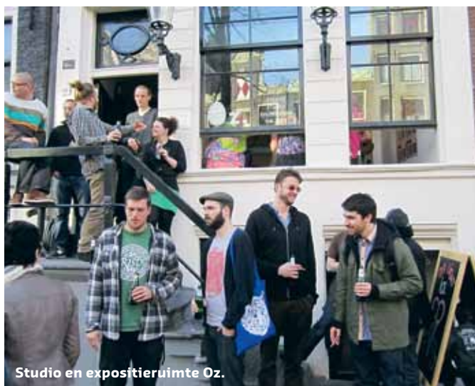
Studio en expositieruimte Oz.