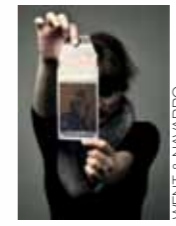
DESIGNER MANON NAVARRO